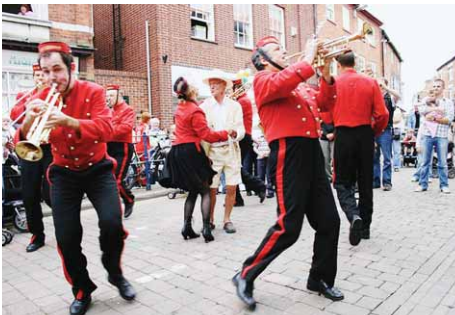
Cinq compagnies, cinq villes du département et quelque 50 spectacles. C'est le programme insolite pensé pour cette nouvelle édition de "La Folle histoire...". Ici, la fanfare tout terrain.

"U ne ville, une semaine, une compagnie", c'est le principe de la nouvelle édition du festival la Folle Histoire des Arts de la Rue. Une pour cinq, cinq pour une... car cette année c'est le chiffre 5 qui pique la vedette! Cinq communes accueillent cinq compagnies (les Espagnols Escarlata Circus, les grooms, les Retouramont, la compagnie Kumulus, Pernette et No tunes International) pour 50 spectacles gratuits sur les thèmes de l'art forain, de la musique (avec les Grooms, notre photo) ou encore de la danse aérienne (avec la compagnie Retouramont). Bref, de multiples raisons de flâner au soleil, dans les rues de Saint-Cannat, Mallemort, Velaux, des Pennes-Mirabeau et de Saint-Rémy. Flâner, les sens en éveil, au son de la fanfare papillonnant de spectacle en création, sous chapiteau ou en extérieur. Accessibles à tous, des personnages farfelus amusent, émerveillent, interpellent. Offrant fantaisie, cruauté ou humour tout en mêlant la gestuelle aux mots.