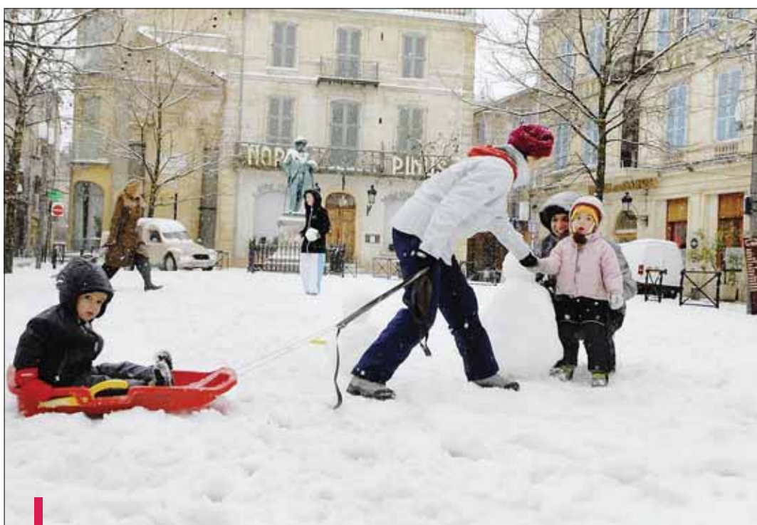
Lors des dernières chutes de neige, l'alerte météo orange avait été lancée grâce à l'automate d'appels de la ville. Qui a été nettement amélioré.