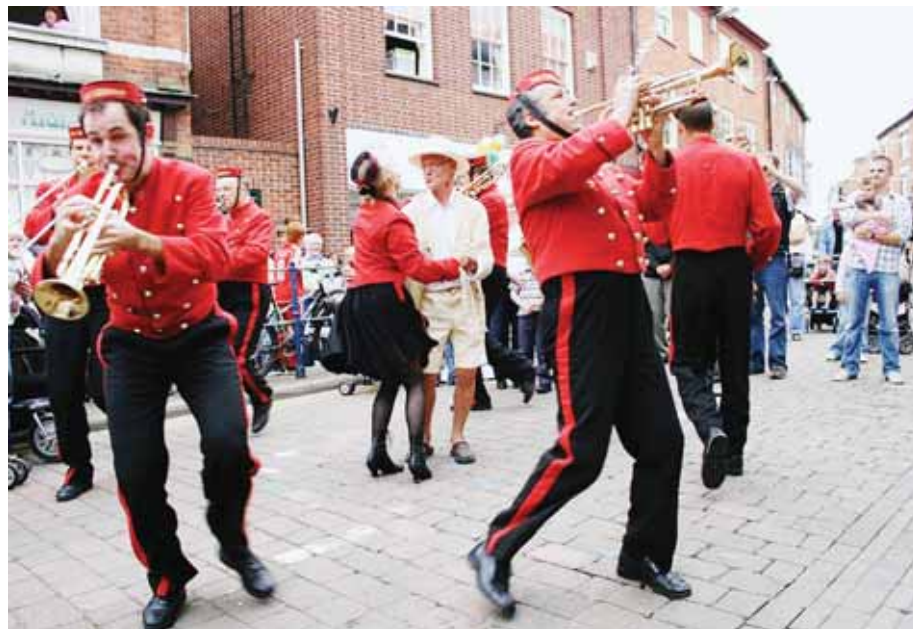
Cinq compagnies, cinq villes du département et quelque 50 spectacles. C'est le programme insolite pensé pour cette nouvelle édition de "La Folle histoire...". Ici, la fanfare tout terrain.

"U"ne ville, une semaine, une compagnie", c'est le principe de la nouvelle édition du festival la Folle Histoire des Arts de la Rue. Une pour cinq, cinq pour une... car cette année c'est le chiffre 5 qui pique la vedette! Cinq communes accueillent cinq compagnies (les Espagnols Escarlata Circus, les grooms, les Retouramont, la compagnie Kumulus, Pernette et No tunes International) pour 50 spectacles gratuits sur les thèmes de l'art forain, de la musique (avec les Grooms, notre photo) ou encore de la danse aérienne (avec la compagnie Retouramont). Bref, de multiples raisons de flâner au soleil, dans les rues de Saint-Cannat, Mallemort, Velaux, des Pennes-Mirabeau et de Saint-Rémy. Flâner, les sens en éveil, au son de la fanfare papillonnant de spectacle en création, sous chapiteau ou en extérieur. Accessibles à tous, des personnages farfelus amusent, émerveillent, interpellent. Offrant fantaisie, cruauté ou humour tout en mêlant la gestuelle aux mots.