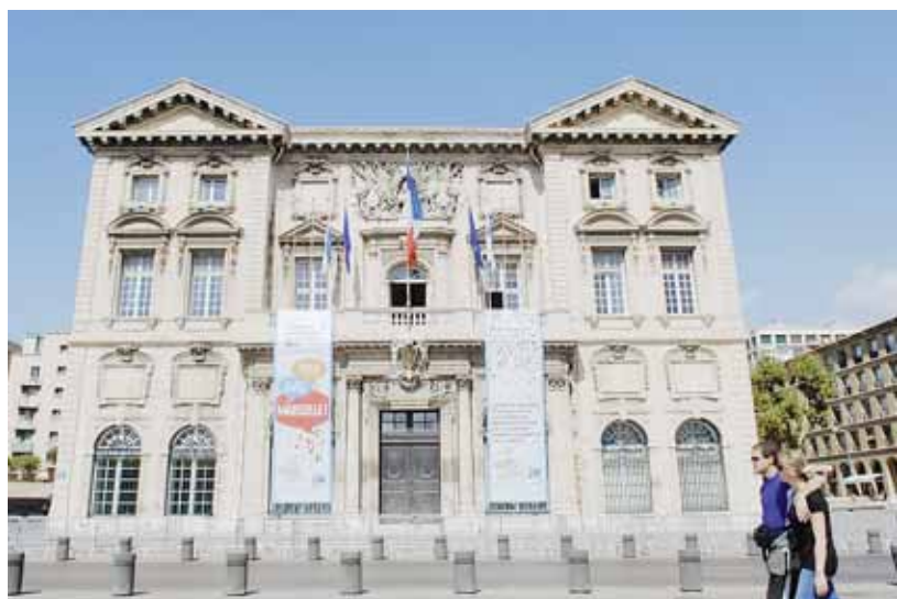
L'hôtel de ville, sur le Vieux-Port, fait partie des circuits de découverte, notamment avec l'office de tourisme, grâce à sa façade ornée du buste de Louis XIV.